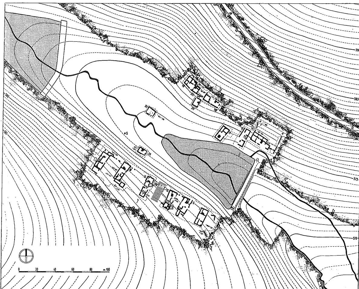
Fig. 1. DV Pfaffenschlag near Slavonice (distr. Jindřichův Hradec). Layout of the completely excavated high medieval village, 13th-15th centuries (Nekuda 1975).

1896; Smetánka - Scheufler 1963) while another group of villages was explored in the Poděbrady region (Hellich 1923). These have not lost their informative value for us (for Moravia Měřtinský 1977-78).